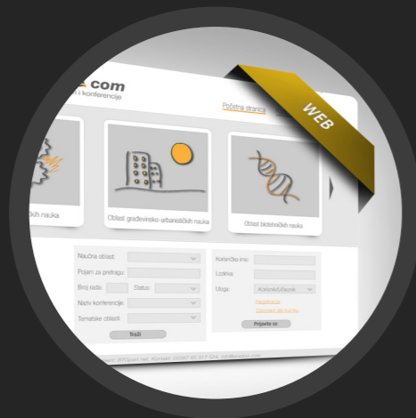
KONFERENCIJSKE WEB STRANICE /02