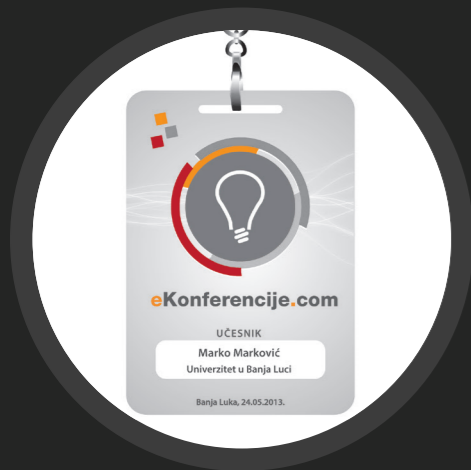
VIZUELNI IDENTITET KONFERENCIJE /01