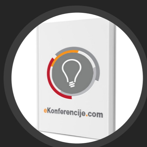
REKLAMNI MATERIJALI /03

MODERAN I PROFESIONALAN DIZAJN ČIST&JASAN.